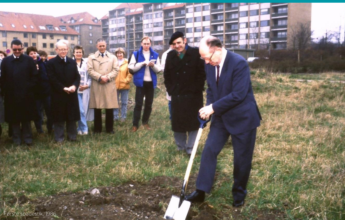
Første spadestik, 1986